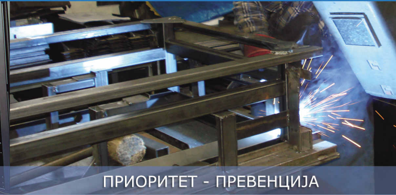
ПРИОРИТЕТ - ПРЕВЕНЦИЈА

У организацији рада посебну пажњу треба усмјерити на примјену превентивних мјера у свим фазама радних процеса, а у циљу спрјечавања и отклањања ризика од могућих повреда или професионалних обољења.