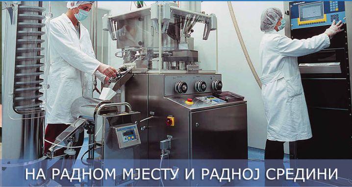
НА РАДНОМ МЈЕСТУ И РАДНОЈ СРЕДИНИ