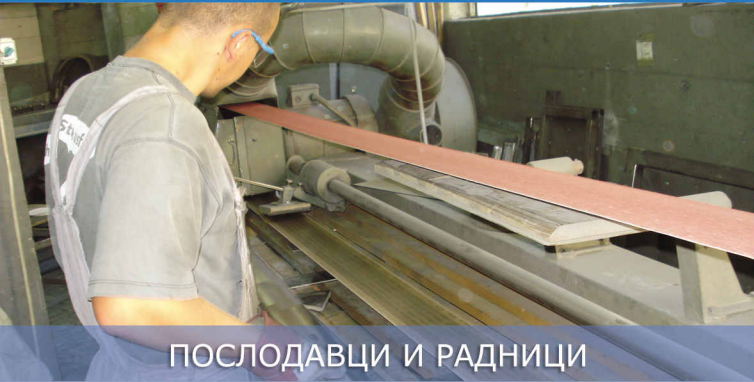
ПОСЛОДАВЦИ И РАДНИЦИ